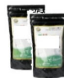
重炭酸入浴剤 2ヶ月分