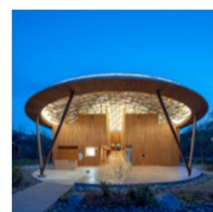
クアパーク長湯 1泊2日のペア宿泊券